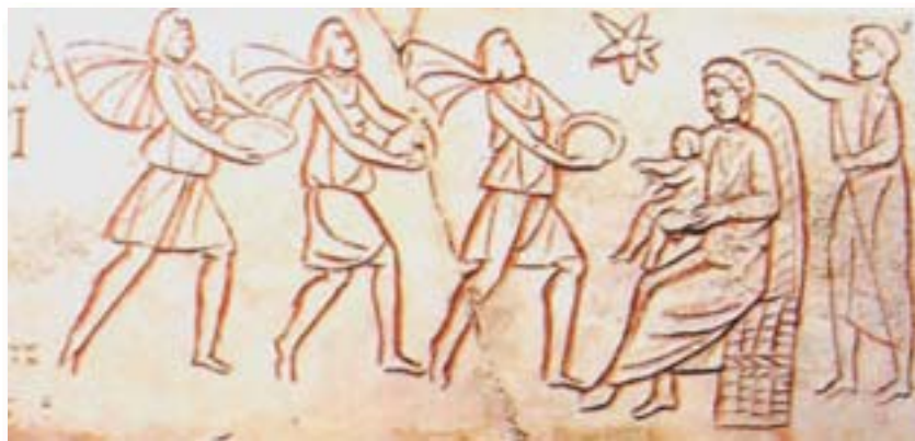
Epigrafe Severa – Museo Pio Cristiano, Roma, sec. III

Manfred Lurker, Dizionario delle immagini e dei simboli biblici , Ed. Paoline, Milano, 1998.