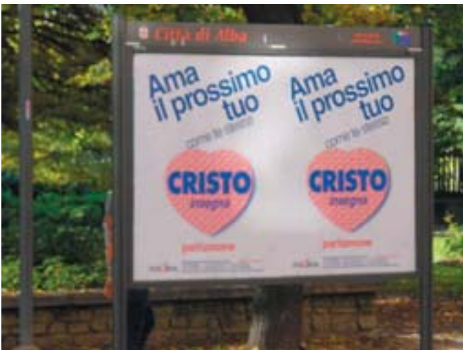
Alba. Campagna pubblicitaria

E per continuare si ripeterà il tutto nel mese di novembre con il manifesto Cristo speranza per il futuro .